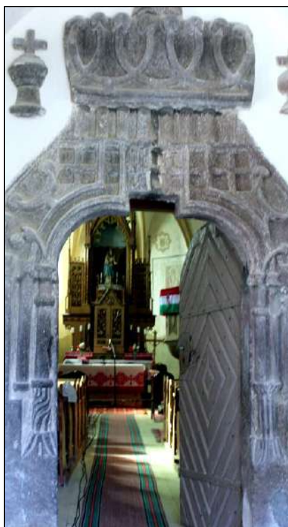
A templom nyugati bejárata

2023. szeptember 24-én, az örökségvédelem ünnepnapja volt Erdélyben: a budapesti Teleki László Alapítvány által kezdeményezett, és a magyar kormány finanszírozásában működő Rómer Flóris-terv keretében egy nap öt, felújított templom ünnepélyes átadására került sor. A Gyulafehérvári Római Katolikus Érsekség és a Teleki László Alapítvány meghívására a szentdemeteri Nagyboldogasszony, székelybői Szent Adalbert, csíkrákosi Kisboldogasszony, a náznai kápolna, és a nagyági Kisboldogasszony templomokban tartott szentmiséken szép számban vettek részt a Magyarországról érkezett hivatalos vendégek és a helyi hívek.