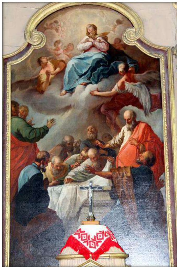
Mária mennybevétele oltárkép

is megfesthettek, ám a falképnek az a része, ahol lehetett, megsemmisült. Ezzel együtt a püspökbot sem volt mindig kötelező Szent Ágoston megjelentésében, pl. A New York-i Frick Gyűjteményben található kis táblaképen, amelyet Piero della Francesca festett 1454 és 1469 között (a szentdemeteri képpel kb. egyidőben), az egyházatya püspöksüveg nélkül áll előttünk, csak egyszerű prémes sapkával a fején, és nem püspökbotot, hanem könyvet tart a kezében.