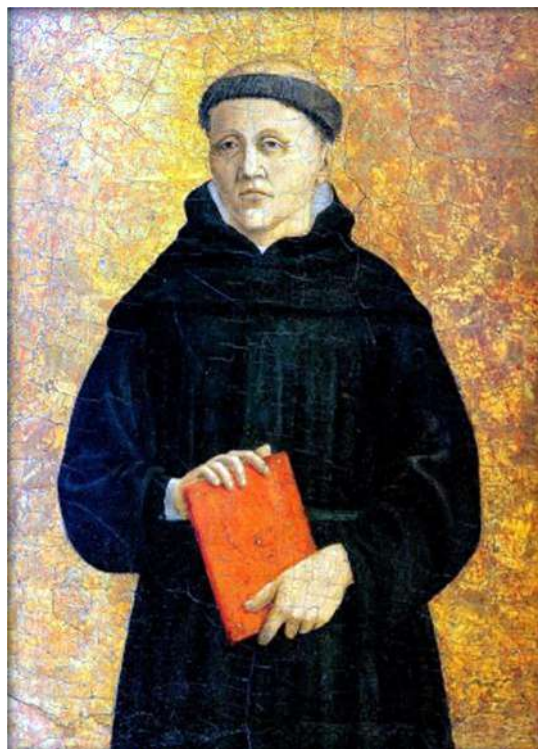
Piero della Francesca: Szent Ágoston

A kézben tartott, Istennek felajánlott, olykor lángoló szív ábrázolásának forrását Szent Ágoston Vallomások című nagy művében olvashatjuk, amelyben így ír szíve Istenéhez szólva: „Szereteted nyilaival átverted szívünket és igéidet bensőnkbe tűzve hordoztuk...” És szívét is felajánlja: „Íme, a szívem, amelyen megkönyörültél a feneketlen mélységben”