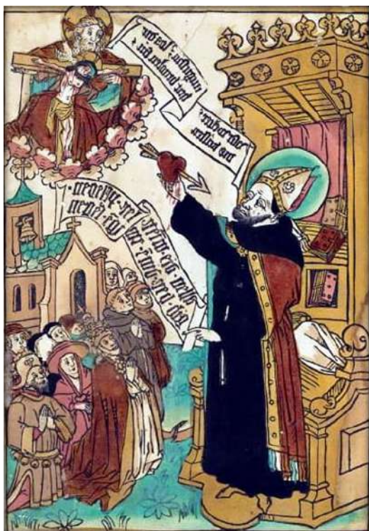
Szent Ágoston szívfelajánlása