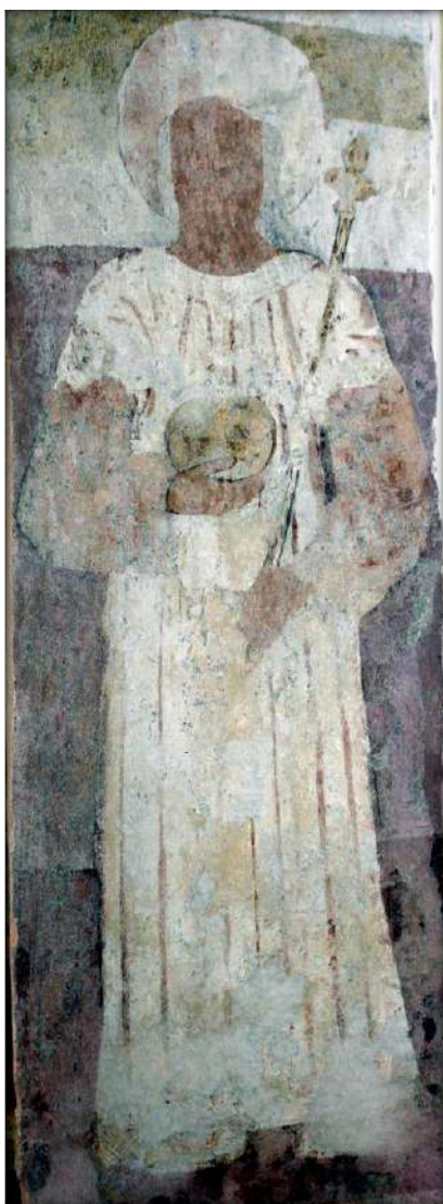
Szent István király