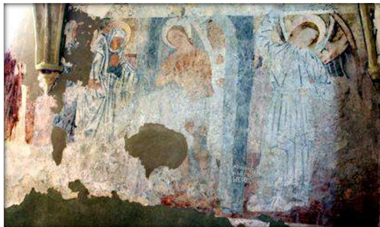
Szenvedő Krisztus és Szent Mihály falképe

tartozó Szentdemeter középkori temploma. A templomba a nyugati kő kapun át juthatunk be, amely Erdélyben nagyon sajátos, gazdag, faragott díszítménnyel van kiképezve. A 13. században épült istenházát az évszázadok során többször átalakították, eredeti állapotát részben a templomhajó, és két román kori, később befalazott, kis ablaknyílása és a déli kapu őrzi. A szentélyt a 15. században késő gótikus stílusban kibővítették, hálóboltozattal fedték be, és falképekkel díszítették. A ma látható, száraz vakolatra, szekkó technikával készült, mára már nagyon megkopott falfestmények között, egy korábbi festett felíratra Szent Péter, Szent Pá alakját, a diadalív déli béléteré Szent Istvánt és a diadalív szentély