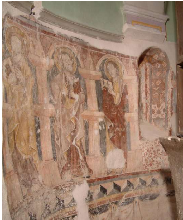
4. Az „apostol galéria”