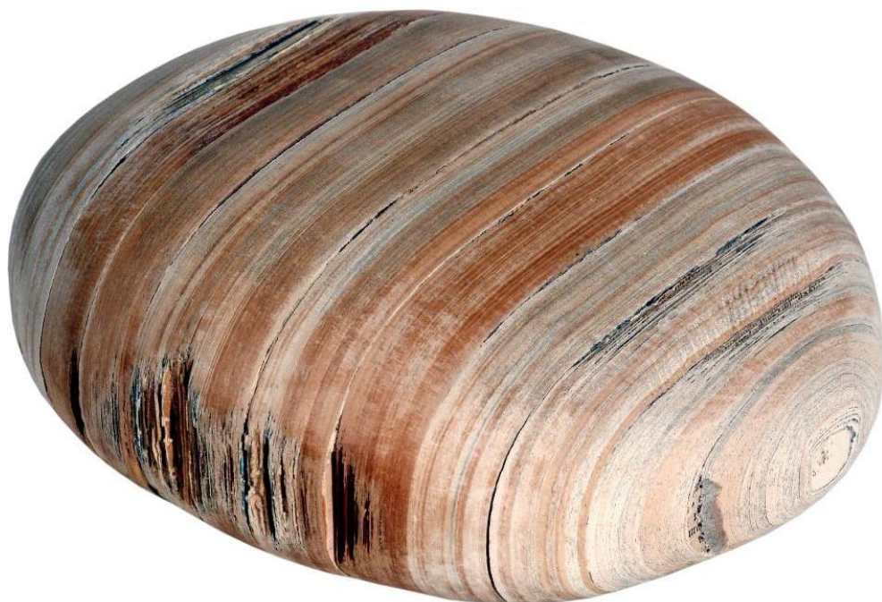
EJBEN Lajos: A lélek kenyere