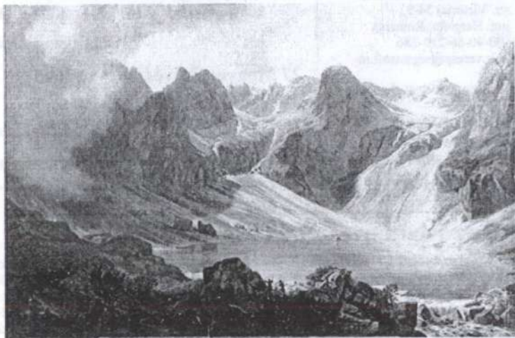
Telepy Károly: Tengerszem, 1886*

Egy kiállítás, mely közel háromszáz, javarészt jó nevű művésztől származó alkotást mutat be, manapság is jelentős kulturális eseménynek számít. Mennyivel inkább szenzáció lehetett száz évvel ezelőtt, amikor ráadásul először rendeztek csoportos képkiallítást Kolozsváron. Műtárgyakat elvértve már