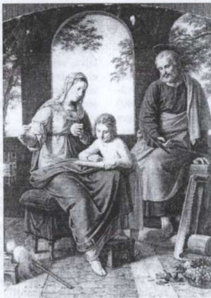
Than Mór: Szent család, 1878**