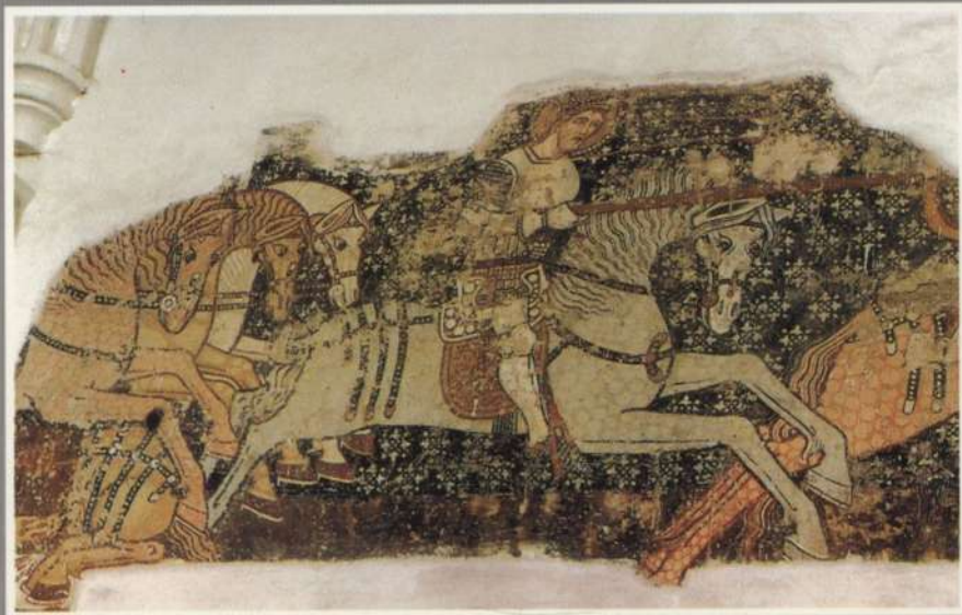
ISMERETLEN; Szent László alakja az 1419-ben festett székelyderzsi unitárius templom falfestményéről