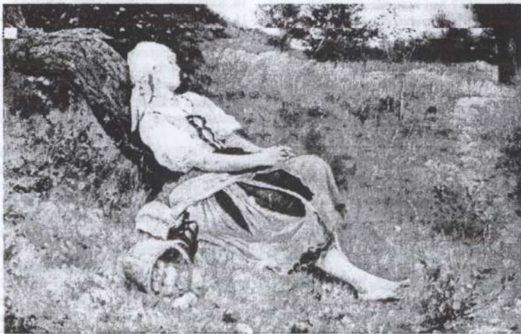
Vastagh Géza: Pihenő parasztlány, 1887****

Kőváry Endre 1832-ben született Tordán, és 1918. augusztus 3-án hunyt el Kolozsváron. 43 A helyi sajtóban neve legkorábban 1859 tavaszán bukkant fel, amikor „a fiatal, tehetséges