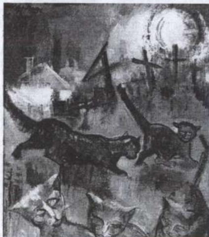
Nagy Imre: Macskák