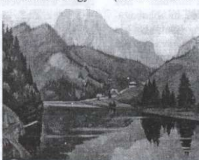
Teleki Ralph: Gyilkos-tó, 1930-as évek, olaj vászon 60x75 cm, j.j.l. Teleki R. MNG Ists. FK 3023

éves kora ellenére a Párizsi Szalon kiállításán jelentkezett. 18 Adatolható az a tény is, hogy Munkácsy biztatására (talán már otthon) „nagyobb kompozíció” megfestésébe kezdett. 19 Az akkori festményekről egy-egy kései kritikái méltatás árul el figyelmet érdemlő részleteket. A fentebb említett korai festmények kapcsán (melyeket Teleki Bella, mint pályaképének útjelzőit, többször is bemutatott) egy 1927-es kiállítási jegyzetében Dénes Sándor arról ír, hogy azokon Munkácsy bitumenes színei fedezhetők föl. 20 A Szénahordás ( Szénásszekér címmel) a Nemzeti Szalon-beli 1935-ös kiállításán is helyet kapott. Ez alkalommal írja Felvinczi Takács Zoltán, hogy a Munkácsyra utaló képek és tanulmányok, melyek „világtól elvonult életet éltek a drassai kastély falain”, míg nem az 1918-as forradalom áldozatai lettek, „a régi Erdélyel pusztultak el.” 21