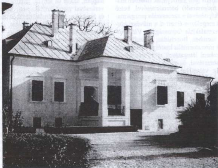
A kendilónai kastély mai képe